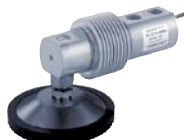
Pied - Loading Foot LFC